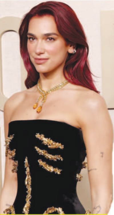
एल्बम का नाम 'रिडिकल ऑप्टिमिज्म' है, जो तीन मई को रिलीज हुआ था।

दुआ लिपा ने हाल में ही बतौर अभिनेत्री अपनी एक नई यात्रा शुरू की है। उन्होंने फिल्म 'बाबी' से फिल्मी दुनिया में कदम रखा है। इसमें उन्होंने एक कैमियो किया है। वह फिल्म 'आर्गिल' में ब्राइस डलास हॉवर्ड, सैम रॉकवेल, ब्रायन क्रैस्टन, हैनरी कैवल आदि के साथ नजर आई थीं। इसके अलावा उन्होंने अपनी बहुप्रतिक्षित तीसरी स्टूडियो एल्बम भी रिलीज की है। इस